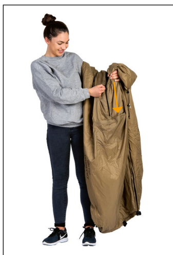
1. Otwórz zamek błyskawiczny