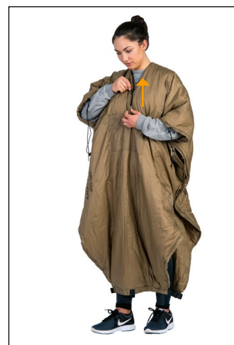
4. Zamknij zamek