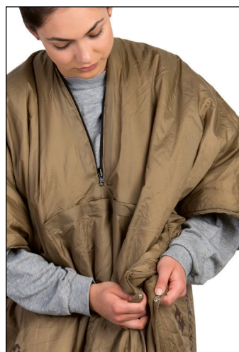
3. Zapnij zatrzaski