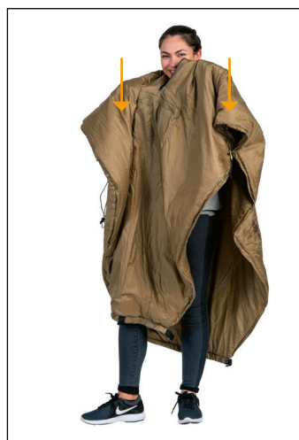
2. Przeciągnij przez głowę