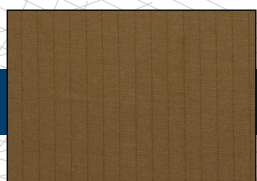
100% nylonowy materiał ripstop

Podszewka z mikrofibry Thermolite® jest wyjątkowo ciepła i przytulna, miękka jak puchowe pierze i bardzo ściśliwa, aby zajmować mało miejsca po spakowaniu. Bez podkładki uziemiającej można go używać w temperaturach ok. zero stopni. W połączeniu z odpowiednią podkładką uziemiającą może wytrzymać temperatury znacznie poniżej zera.